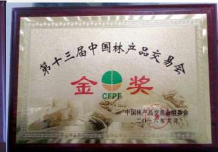
林产品交易会金奖