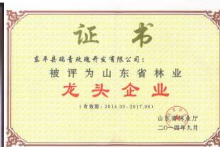
省级林业龙头企业