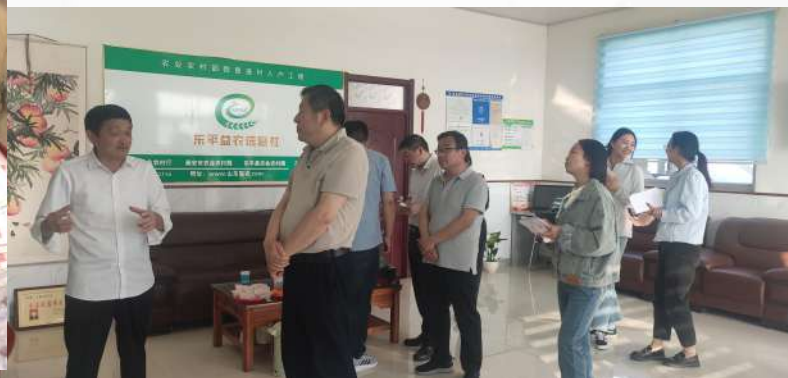
省农业农村局带队调研玫瑰生产