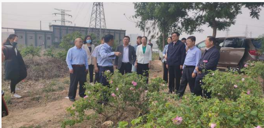
市卫健局考察中药种植情况