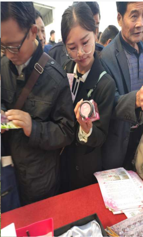
农业农村局带队参观园区