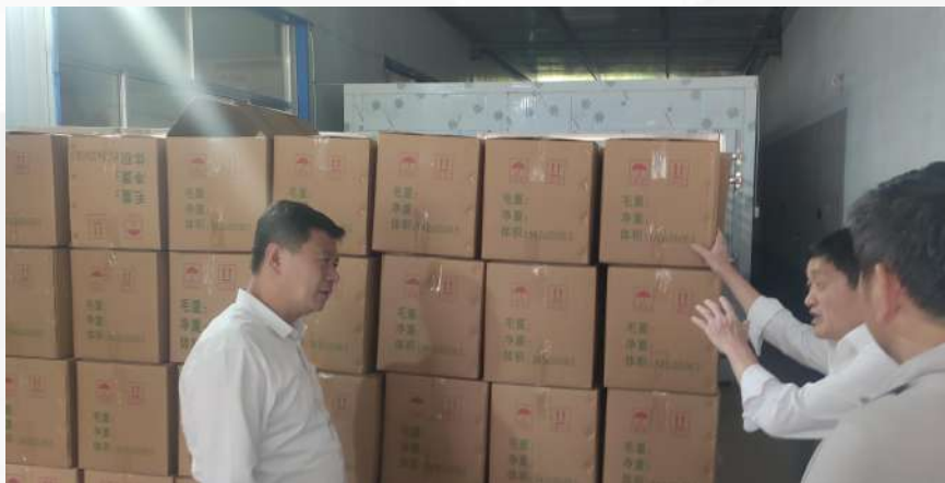
县农业农村局了解玫瑰收获情况