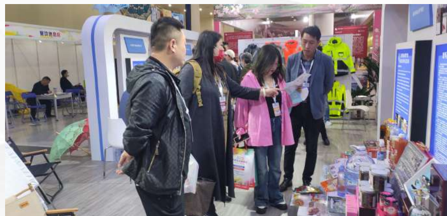
济南外贸优品展销会