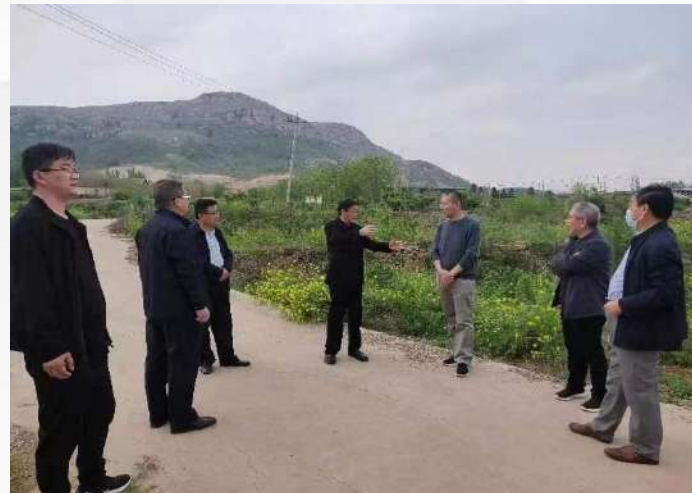
市农业农村局考察玫瑰种植