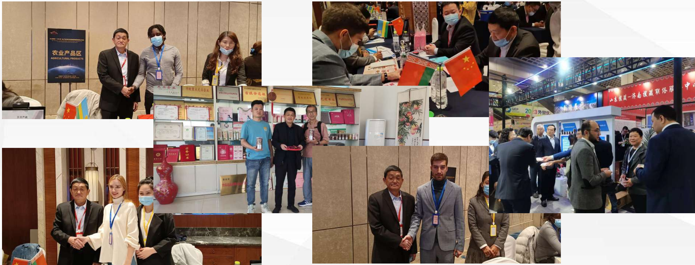
中间为日本客商参观考察