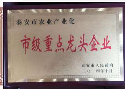
市级重点龙头企业