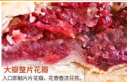
大瓣整片花瓣 入口即触片片花瓣，花香香浓芬芳。